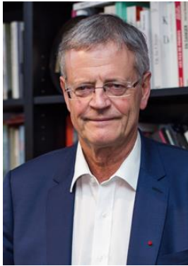
Pascal BONIFACE , Géopolitologue, Fondateur et Directeur de l'IRIS

Pascal Boniface est fondateur et directeur de l'IRIS (Institut de Relations Internationales et Stratégiques).